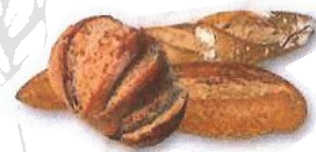
Zekale ogia Pain de seigle