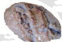
Intxaurre ogia Pain aux noix