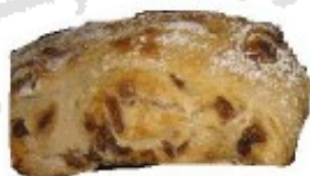
Piku ogia Pain aux figues