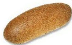
Zahi ogia Pain au son