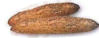
Sesamo ogia Pain au sésame