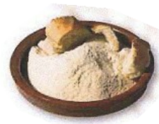
Ogi birrindua Chapelure