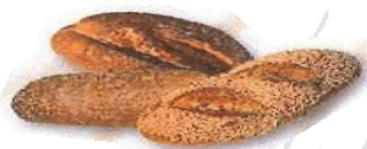
Labore ogia Pain aux céréales