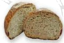
Ogi altxagarriduna Pain au levain