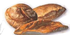
Baserriko ogia Pain de campagne