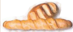
Vienako ogia Pain viennois