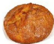
Arto ogia Pain au maïs