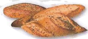
Soja ogia Pain au soja