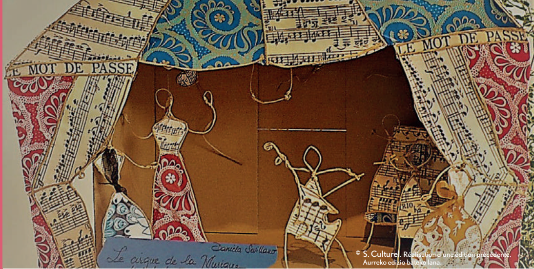
© S. Culture, Réédition d'une édition précédente. Aurreko edizio batetako lana.