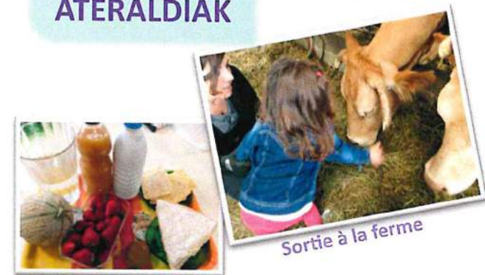
Sortie à la ferme