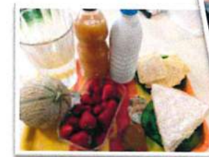
Collation du matin