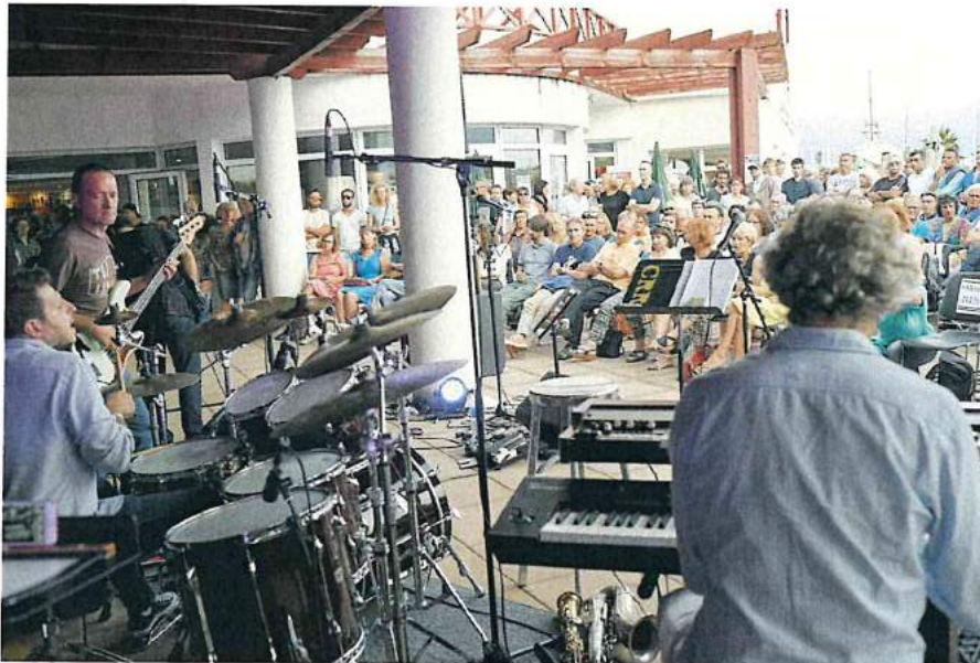
« LA terrasse » S. Blanco Talassoterapian

Horrenbestean, azken horiek festibalaren antolatzaileetarik kokatzen zaizkigu, Guitaralde elkartearen ondoan, eta Off aldean ari diren artistei aritzen laguntzen diete (egitarau ofizialean bai baina afixa nagusian agertzen ez diren tokiko musikariak).