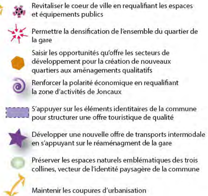
Carte illustrative des orientations générales